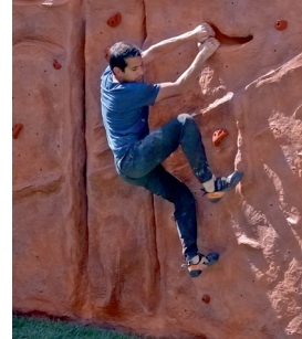
Odolná vůči vodě, mrazu a UV záření