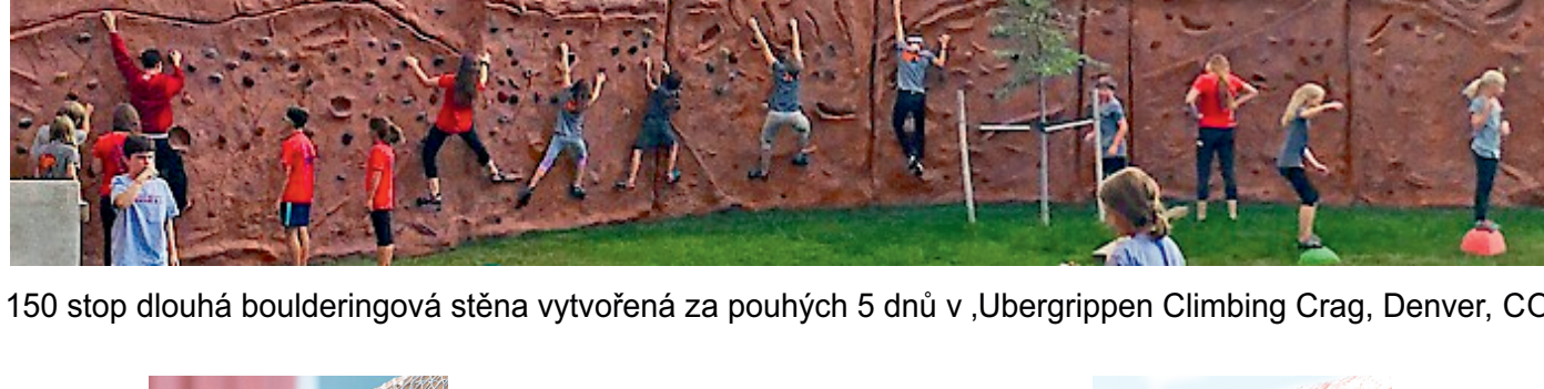
150 stop dlouhá boulderingová stěna vytvořená za pouhých 5 dnů v ,Ubergripen Climbing Crag, Denver, CO