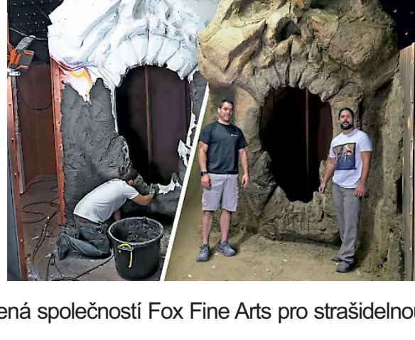
15 stop vysoká lebka vytvořená společností Fox Fine Arts pro strašidelnou atrakci v Six Flags America

Lehký: Až o 30 % lehčí než jiné betonové směsi