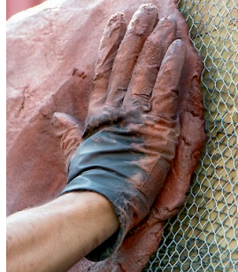
Vysoká stavební tloušťka - až 10 cm